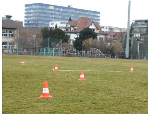
Die Markierung der Laufrunde wurde in diesem Beispiel mittels Pilonen vorgenommen. Die Teamposten sind mit je einer Pilonen und Absperrband auf dem Boden bezeichnet.