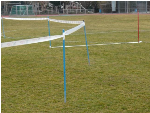
In diesem Beispiel wurde die Laufrunde mit blauen Malstäben und Absperrband markiert. Die Teamposten wurden mit je einem roten Malstab und Absperrband auf dem Boden gekennzeichnet.

Beim Aufbau der Anlage für die Durchführung der Lauf-Spring-Stafette geht es einerseits um die Markierung / Absteckung der Laufrunde und andererseits um die Markierung der Posten (Startpunkte) für die Teams. An diesen Posten erzielen die Teams durch das gemeinsame Springseilspringen Punkte und dort werden ihre absolvierten Runden gezählt.