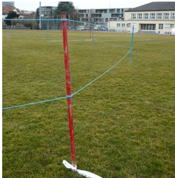
In diesem Beispiel wurde die Laufrunde mit Malstäben und Dochten-band markiert.