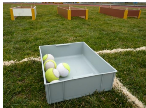
In diesem Beispiel wurden Schwedenkastenelemente als Zielbehälter eingesetzt. Für die Tennisbälle kann ein zusätzlicher Behälter bereitgestellt werden.