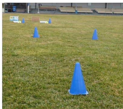
Als Bahnbezeichnungen sind in diesem Beispiel Pylonen eingesetzt worden.