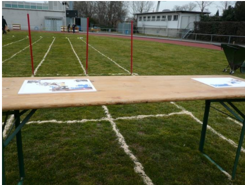
In diesem Beispiel sind die Bahnen mit Sägemehl markiert, die Startlinie zusätzlich mit Malstäben gekennzeichnet. Als Puzzlestationen wurden Tische eingesetzt.

Beim Aufbau der Anlage für die Durchführung der Puzzle-Biathlon-Stafette geht es einerseits um die Markierung der Start- und Abwurfline sowie andererseits um die Bezeichnung der parallelen Bahnen für die Teams. Daneben gibt es verschiedene Möglichkeiten für die Bereitstellung der Wurfbälle und der Puzzleteile. Ebenfalls lassen sich je nach vorhandenen Materialien verschiedenartige Wurfziele einsetzen.