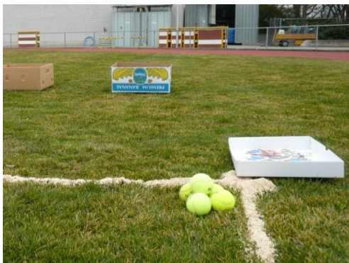
Hier ist eine Grossansicht der Wurflinie (mit Sägemehl gekennzeichnet) zu sehen, zusammen mit den bereitliegenden Tennisbällen und Puzzleteilen sowie einer Bananenschachtel als Zielbehälter.