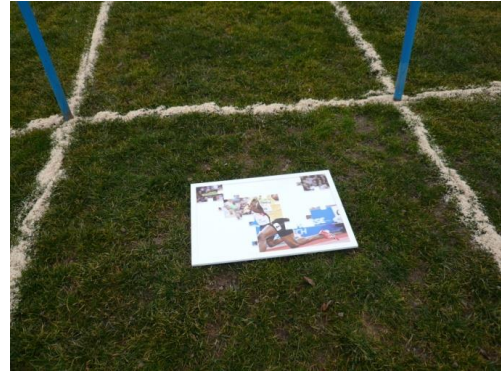
Es ist auch möglich die Puzzles direkt auf dem Boden zusammenzusetzen.