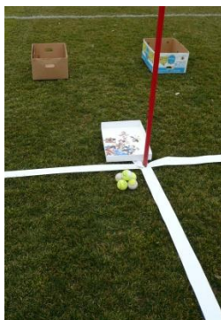
In diesem Beispiel wurde Absperrband als Bahnbezeichnung eingesetzt.